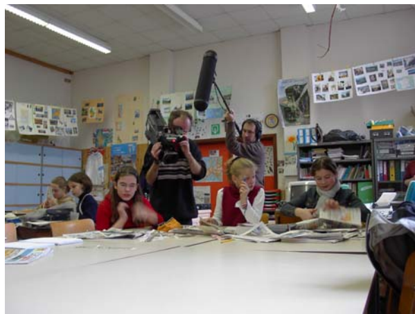
Une quinzaine d'enseignants se sont proposés pour accueillir l'équipe de Média Animation dans leur classe comme ici à l'école Saint Martin de Jauche.