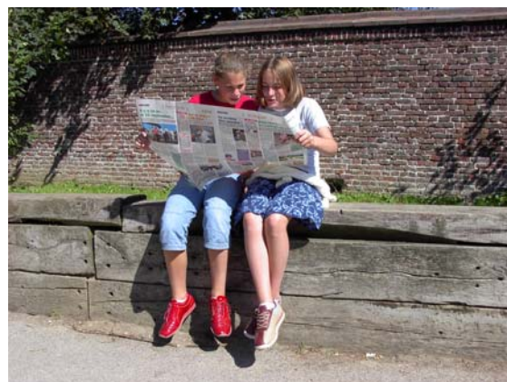
lire le journal... aussi par plaisir.

Elles sont également disponibles dans le syllabus « La presse écrite » édité par le Centre technique et pédagogique de la Communauté française et distribué lors des formations.