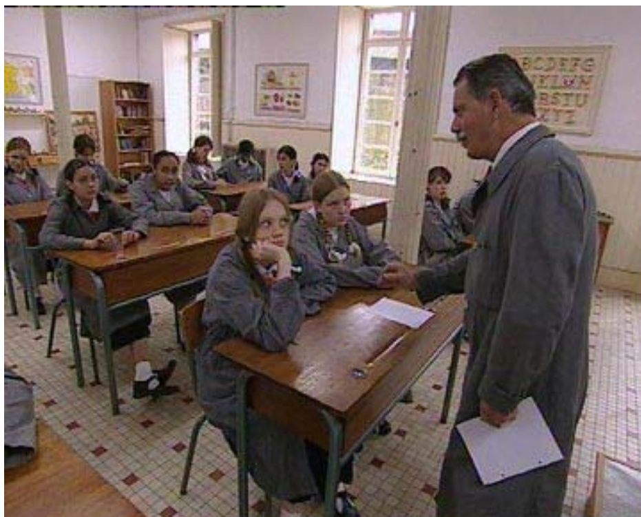
Le pensionnat de Chavagnes, sur M6 (rediffusé sur plug TV) met en scène de jeunes pensionnaires dans les conditions des années 50.

Dans l'histoire de la télévision, un des tout premiers documentaires était « la sortie de l'usine » des