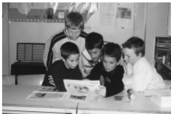
Faire rentrer le journal dans les familles en passant par l'école

Les multiples objectifs de l'opération « Ouvrir mon quotidien » se basent sur le contexte de l'actualité qui rappelle chaque jour l'importance d'une éducation des enfants à une citoyenneté active et à une capacité d'analyse critique de la société. En participant à l'opération, les enseignants du cycle supérieur pourront mettre en œuvre des démarches spécifiques d'éducation aux médias.