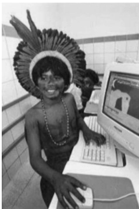
Pas de frontières pour le courrier électronique...

À travers cette activité, l'éclairage est mis sur la troisième compétence d'intégration : « Être critique face aux médias ». Elle met l'élève en situation de se forger une opinion, de s'interroger et d'exercer petit à petit un jugement.