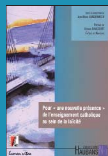
Pour "une nouvelle présence" de l'enseignement catholique au sein de la laïcité

sous la direction de Jean-Marie VANDERMEER Éditions de l'Atelier / Lumen Vitae, 2007