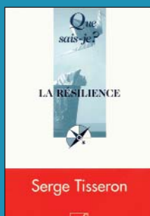
Serge TISSERON La résilience