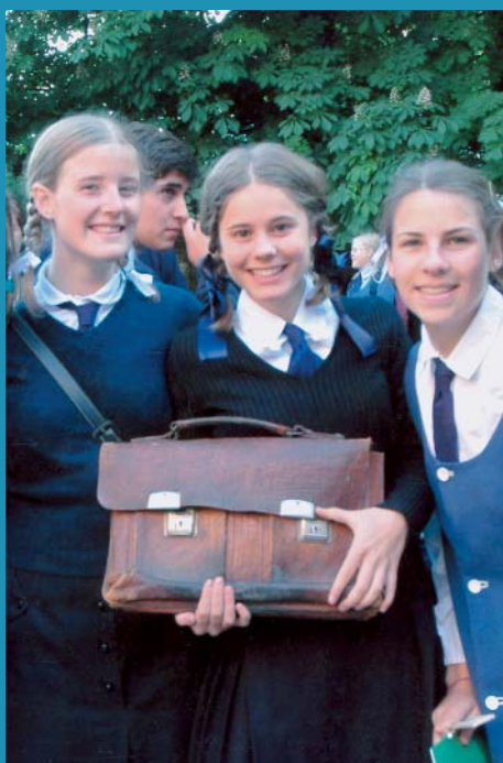
Annie ERNAUX Les années Gallimard, 2008